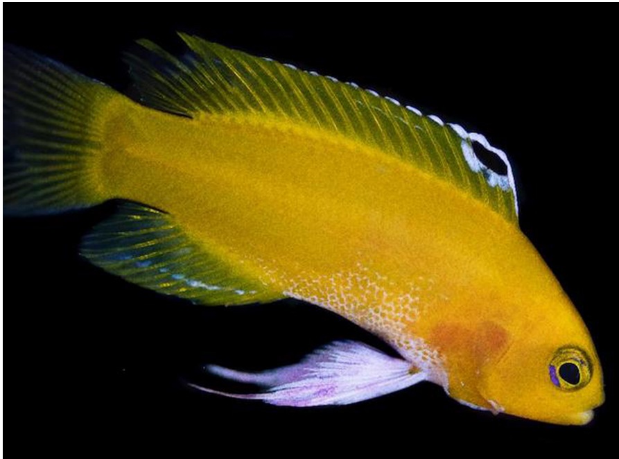
Een blik op de unieke witte vinnen die de “Platinum”-variant van de al zeldzame Gramma dejongi nog zeldzamer maken.

Door Jake Adams – Vertaling: Germain Leys