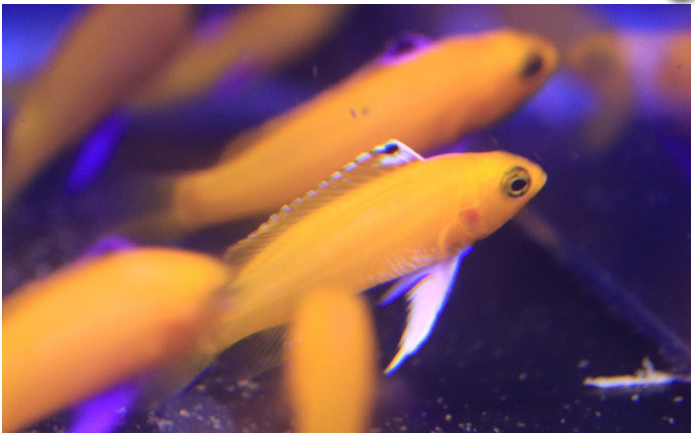
Een 'platina' of 'witte' vorm van Gramma dejongi die tussen zijn normaal gekleurde broers en zussen zwemt.