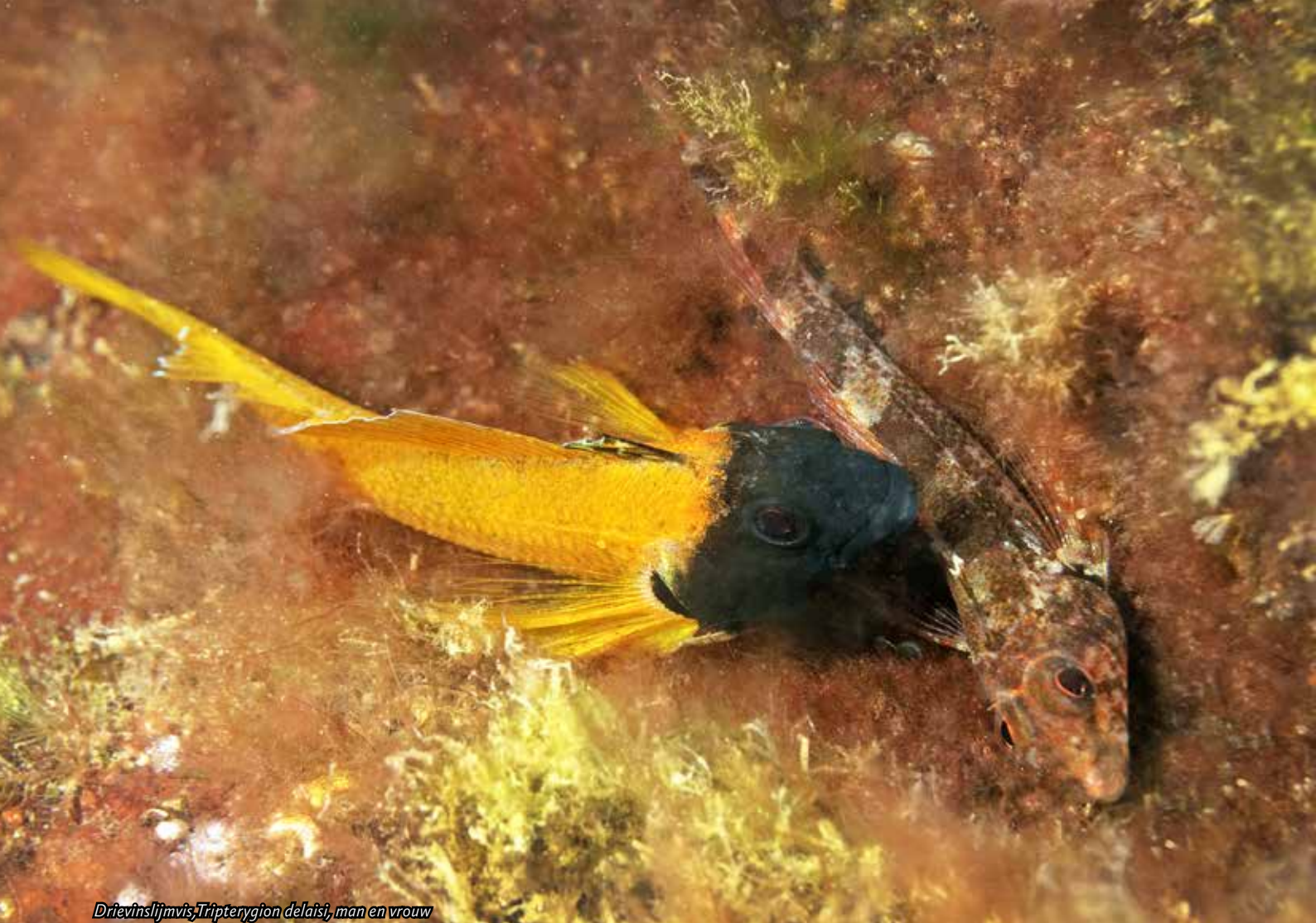
Drievislijmvis, Tripterygion delaisi, man en vrouw