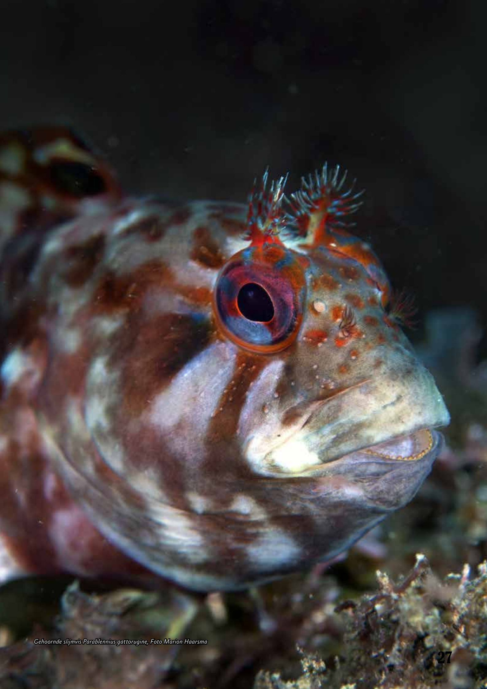
Gehoornde slijmvis Parablennius gattorugine