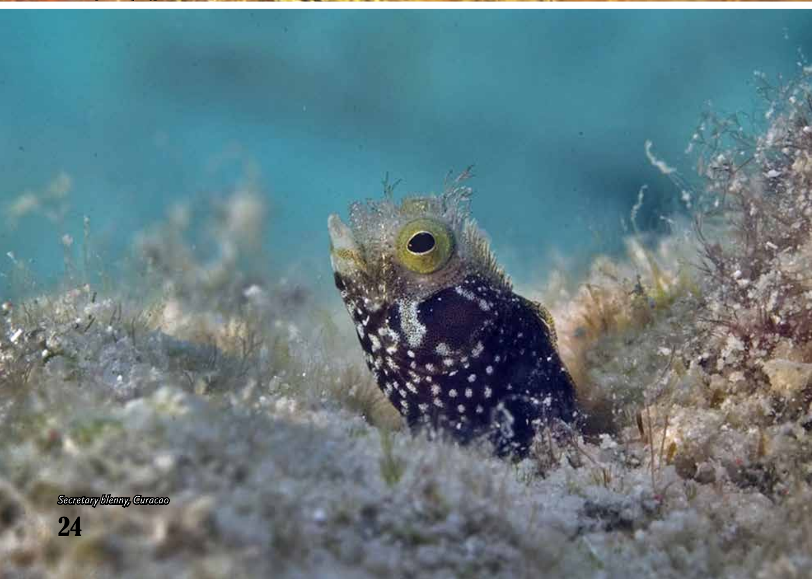
Secretary blenny, Curacao