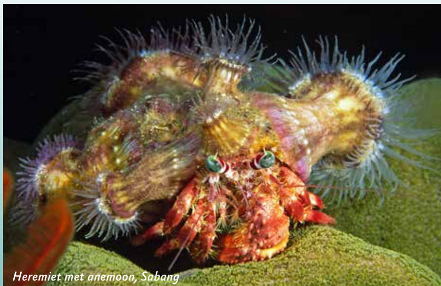
Heremiet met anemoon, Sabang