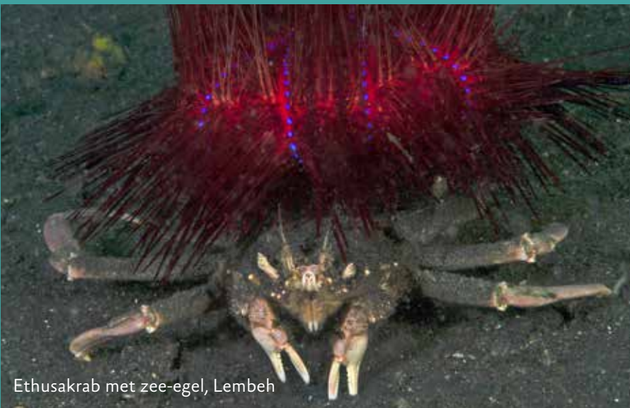
Ethusakrab met zee-egel, Lembeh