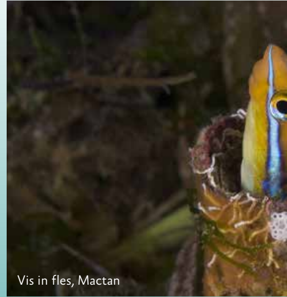
Vis in fles, Mactan