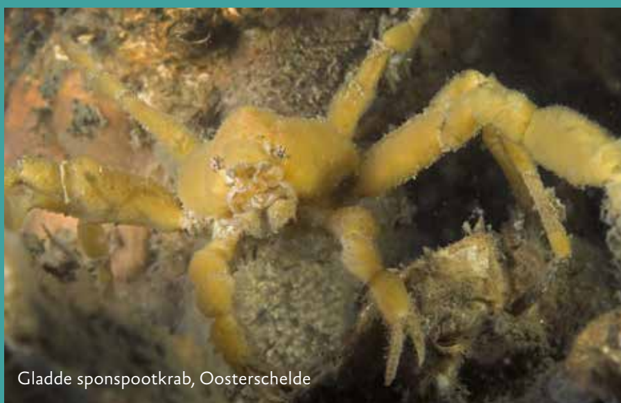
Gladde sponspootkrab, Oosterschelde