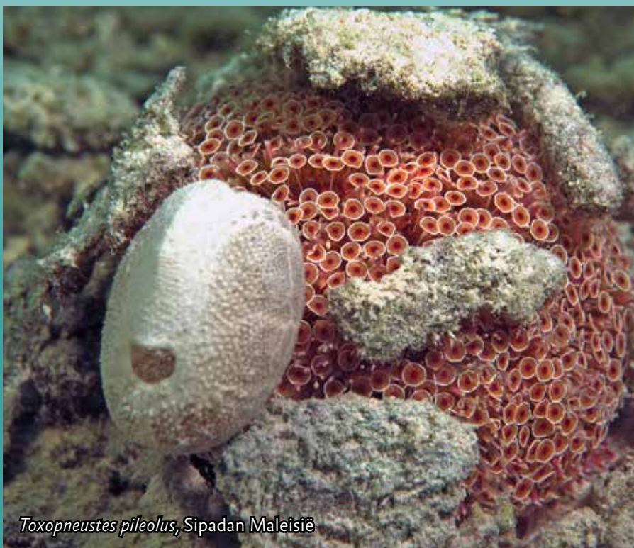
Toxopneustes pileolus , Sipadan Maleisië