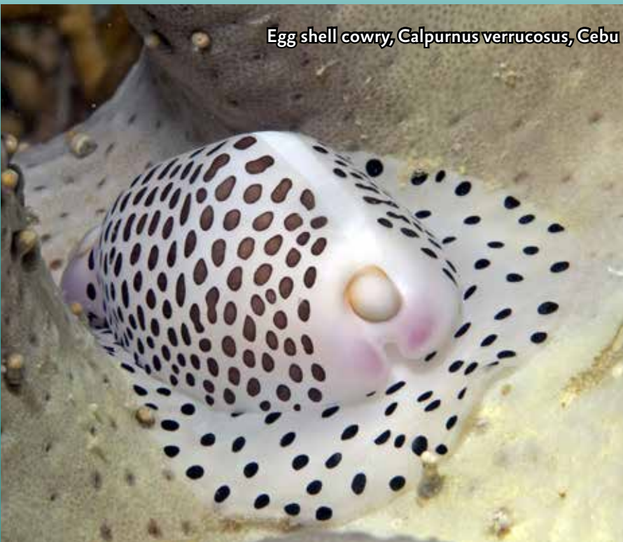
Egg shell cowry, Calpurnus verrucosus , Cebu