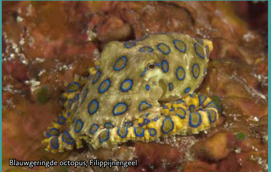
Blauwgeringde octopus, Filippijnengeel