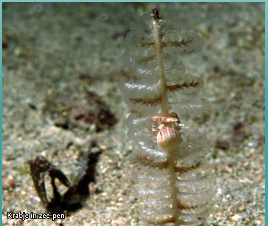
Krabje in zee-pen