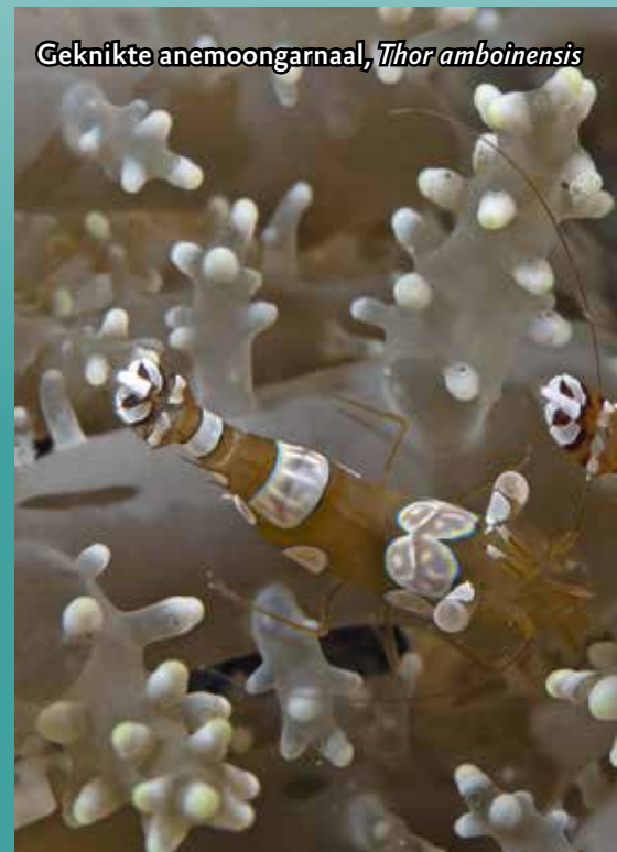
Geknikte anemoongarnaal, Thor amboinensis