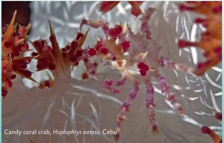
Candy coral crab, Hoplophrys oatesii , Cebu