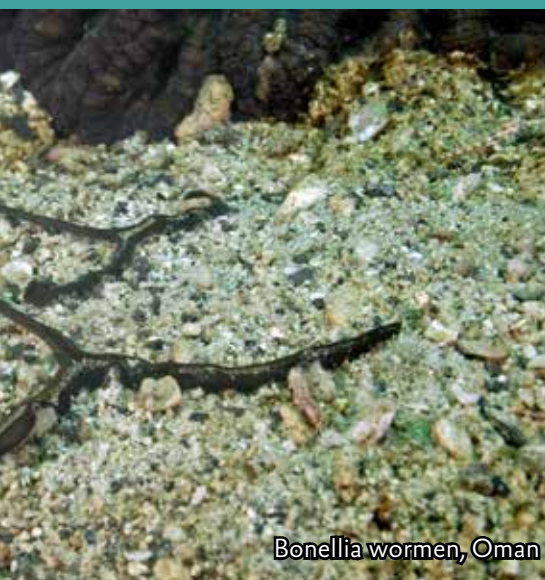
Bonellia wormen, Oman