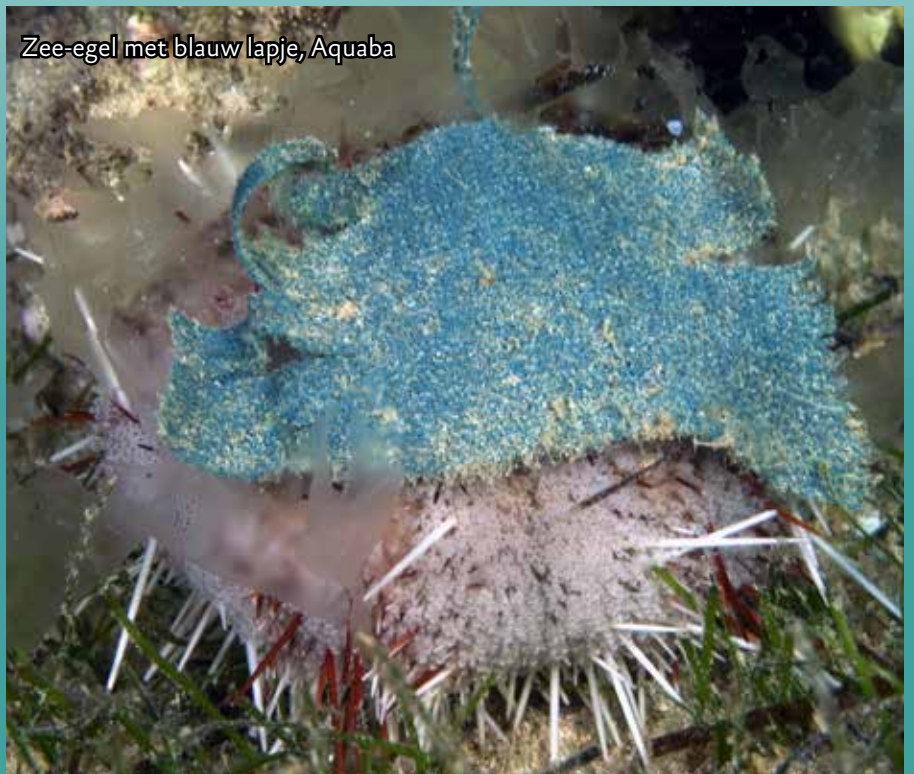
Zee-egel met blauw lapje, Aquaba