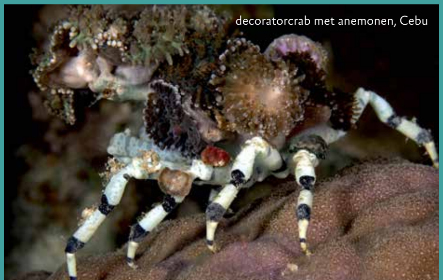
decoratorcrab met anemonen, Cebu