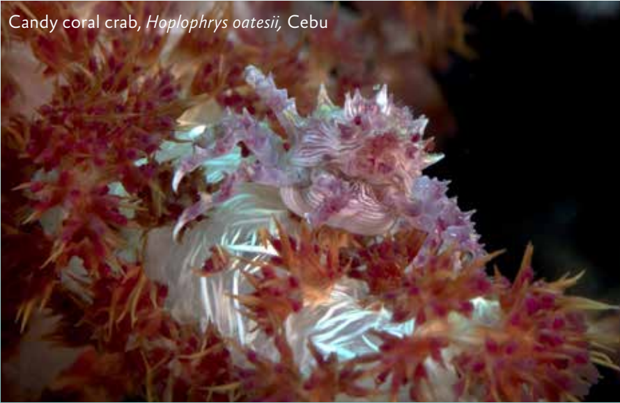
Candy coral crab, Hoplophrys oatesii , Cebu