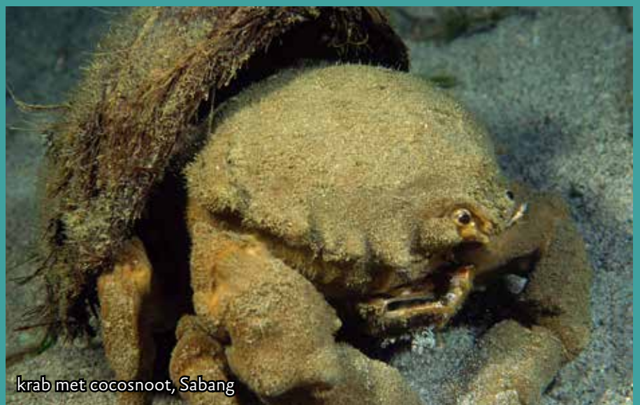
krab met cocosnoot, Sabang