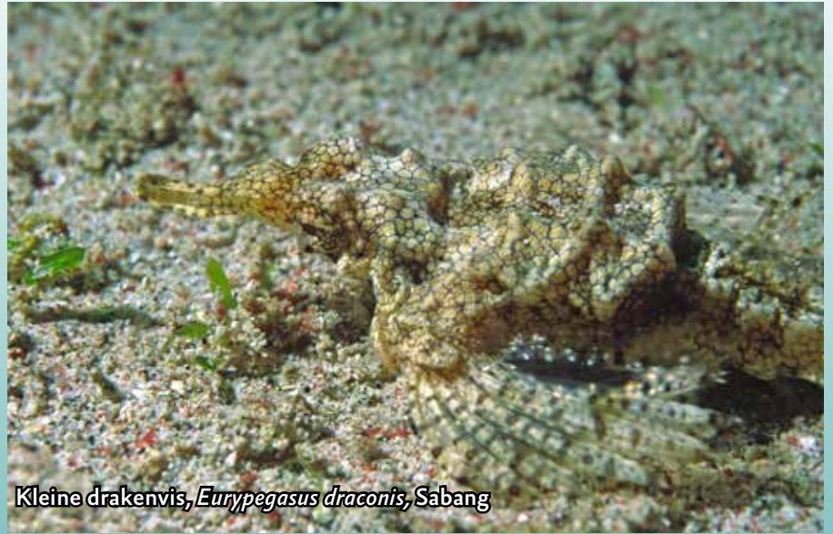
Kleine drakenvis, Eurypegasmus draconis , Sabang