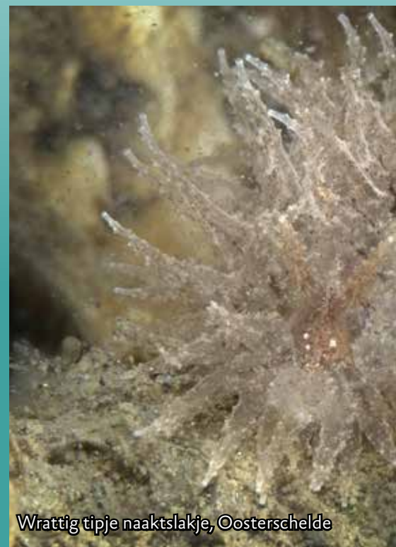
Wrattig tipje naaktslakje, Oosterschelde