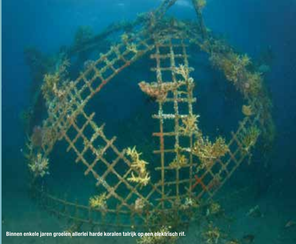
Binnen enkele jaren groeien allerlei harde koralen talrijk op een elektrisch rif.

Wanneer je bij een van deze elektrische riffen duikt, merk je helemaal niets van de elektriciteit die er loopt.