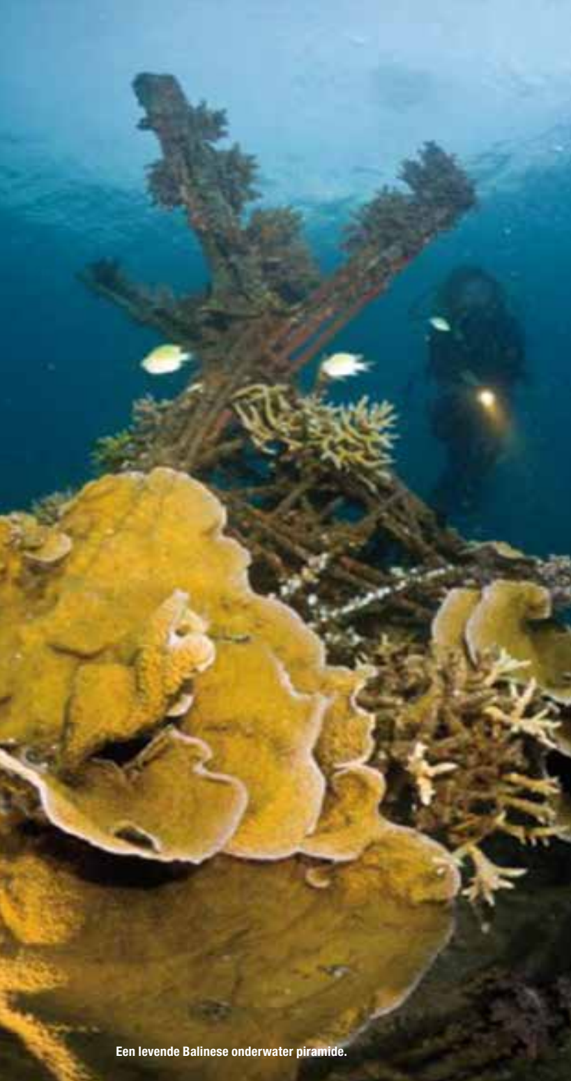
Een levende Balinese onderwater piramide.