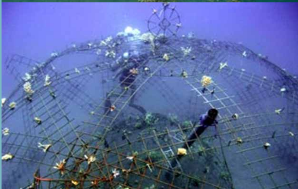
Elektrische riffen kunnen in allerlei vormen worden geconstrueerd.