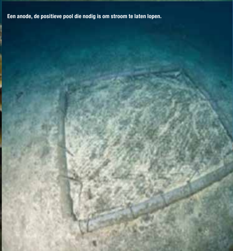
Een anode, de positieve pool die nodig is om stroom te laten lopen.

Alleen de kleine gasbelletjes waterstof die ontsnappen vanaf het metalen frame verraden de stroom. Inmiddels zijn al op veel plaatsen in de hele wereld met ernstig beschadigde koraalriffen, zoals in Indonesië, Jamaica, Malediven, Mexico, Panama, Papoea-Nieuw-Guinea, Seychellen, Thailand en Palau succesvolle Bio-rockprojecten gestart. Hopelijk komen er in de toekomst nog meer projecten, want het is een positieve manier om de lokale bevolking bewust te maken van het belang van koraalriffen. Doordat zij altijd nauw betrokken worden bij deze projecten, zien zij in dat het zin heeft: een gezond koraalrif trekt vis en duikers aan en dat betekent inkomsten!