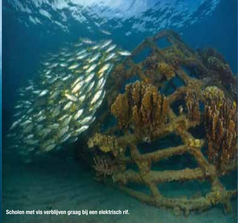
Scholen met vis verblijven graag bij een elektrisch rif.