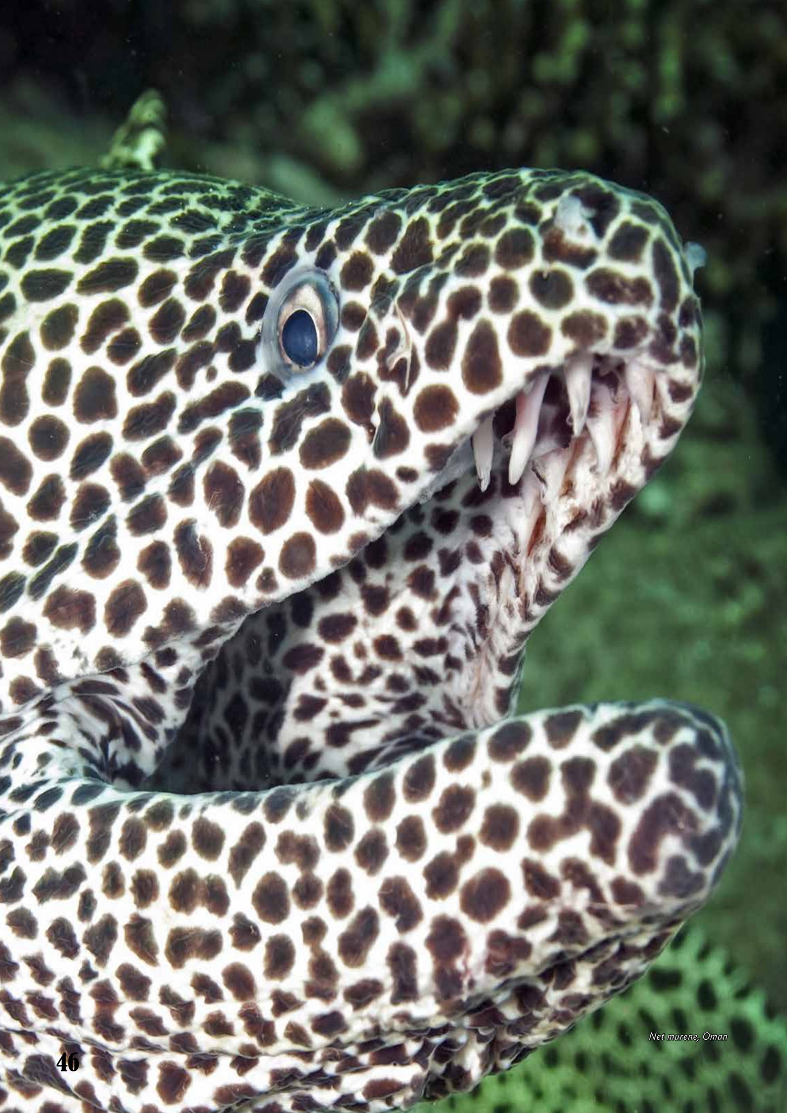
Net murene, Oman