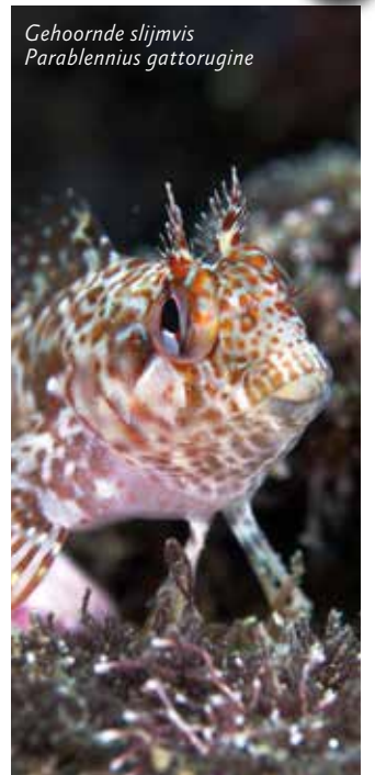
Gehoornde slijmvis Parablennius gattorugine