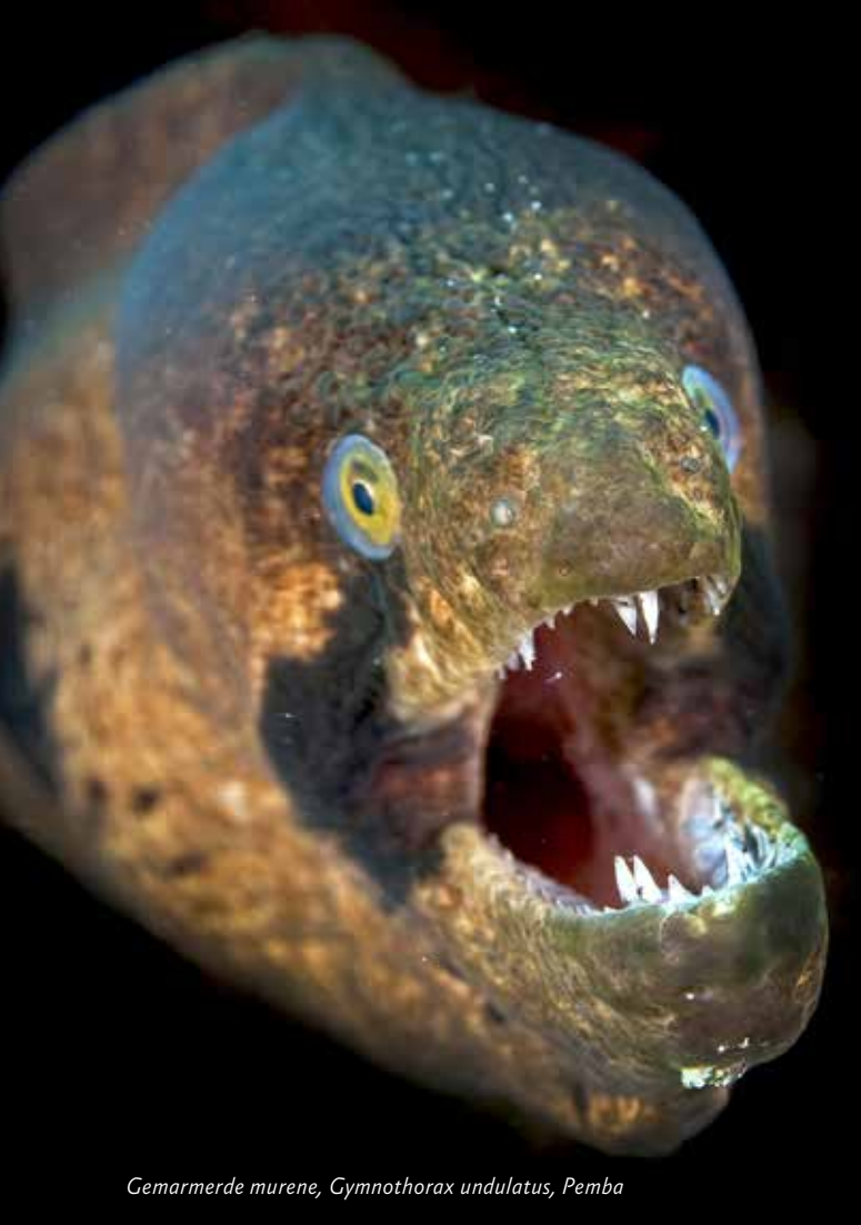
Gemarmerde murene, Gymnothorax undulatus, Pemba