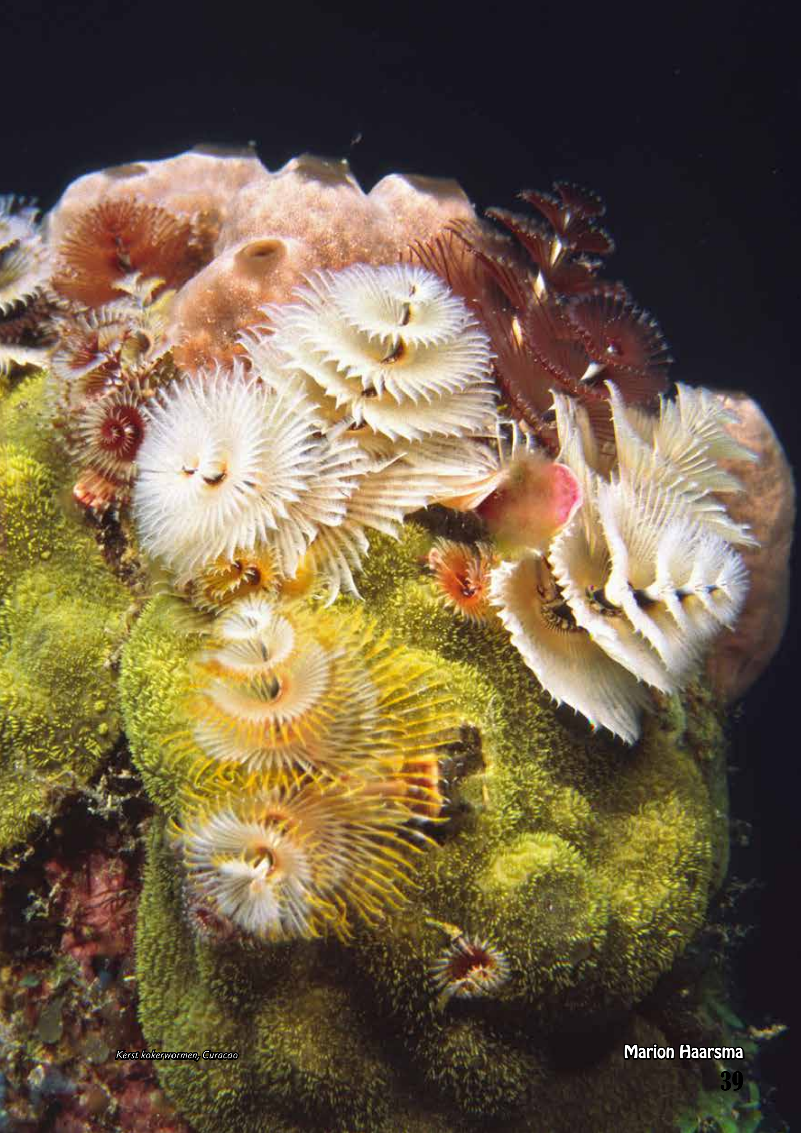
Kerst kokerwormen, Curacao