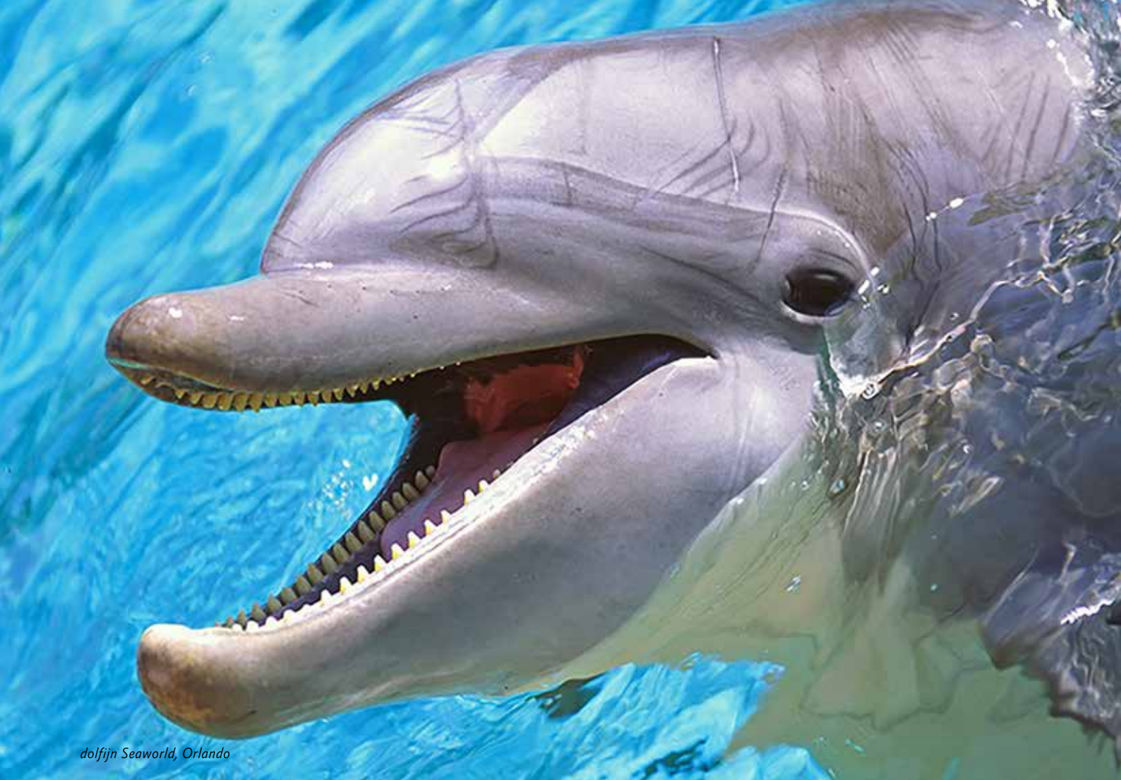
dolfijn Seaworld, Orlando