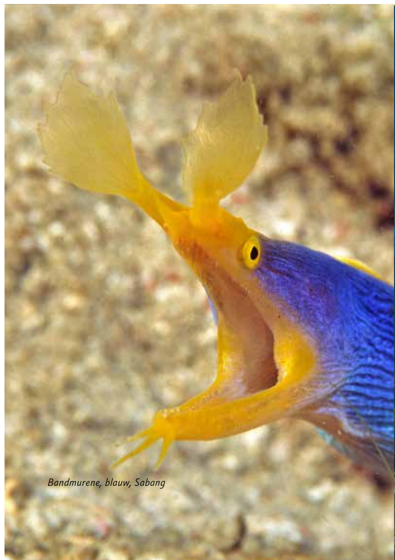
Bandmurene, blauw, Sabang