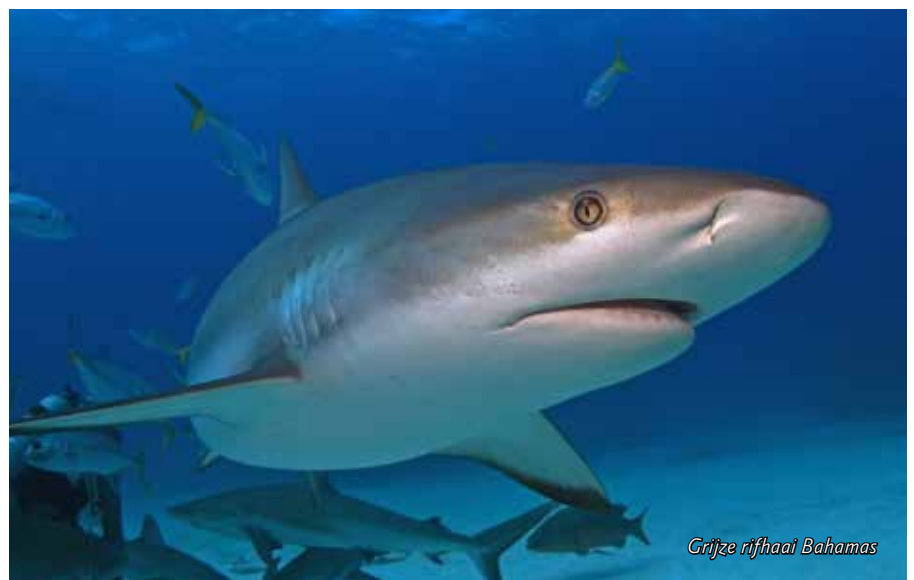
Grijze rifhaai Bahamas

hij gebruikt zijn gebit eigenlijk uitsluitend om met zijn tanden een hapklare brok in zijn mond te brengen, waar deze door de kiezen zodanig