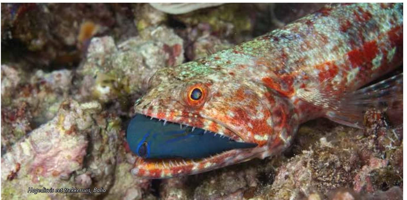
Hagedisvis eet trekkervis, Balio