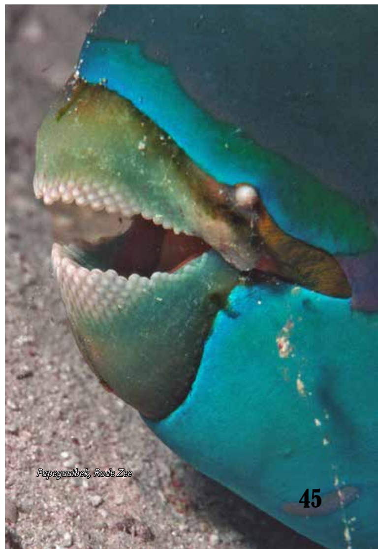
Papegaaibek, Rode Zee