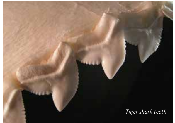
Tiger shark teeth

Typerend voor de familie van de papegaaivissen (SCARIDAE) is de op een papegaaisnavel lijkende bek. Hiermee verwijderen ze levende koralen of schrapen algen van het substraat. Ze hebben een heel krachtig gebit, bestaande uit tandplaten of heel kleine tandjes. Koralen worden hiermee tot zand vermalen en weer uitgescheiden. Het koraalzand is grotendeels van deze vissen afkomstig. Vissen in de categorie 'zuighappers' hebben een bijzondere manier van jagen. Ze blijven roerloos en zeer goed gecamoufleerd op dezelfde plaats, waarbij ze door hun lichaamstekening en -vorm bijna in hun omgeving opgaan. Ze zijn haast niet te onderscheiden. Komt een prooi voldoende dichtbij, dan schieten ze bliksemsnel naar voren. Hierbij openen ze hun enorme bek, waardoor een onderdruk ontstaat en het slachtoffer in