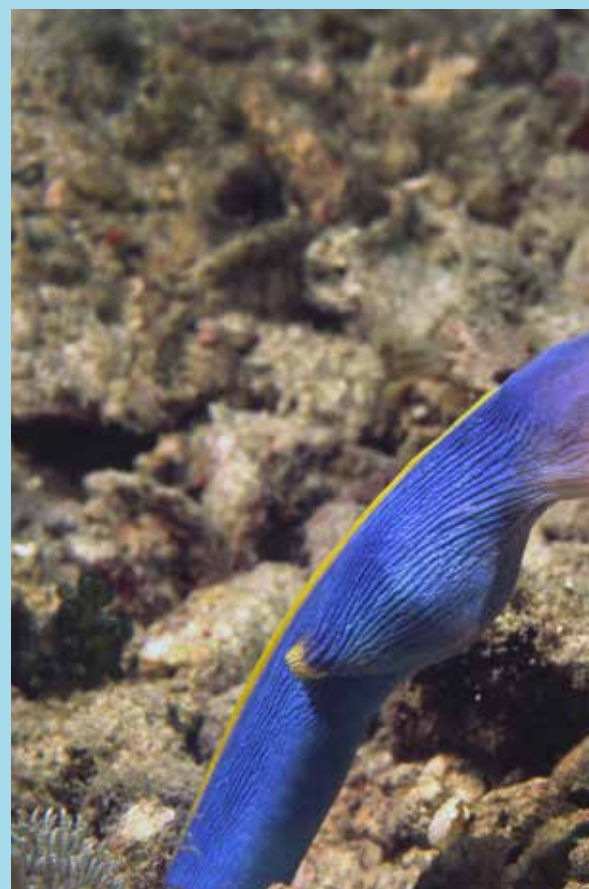
Bandmurene blauw Sabang