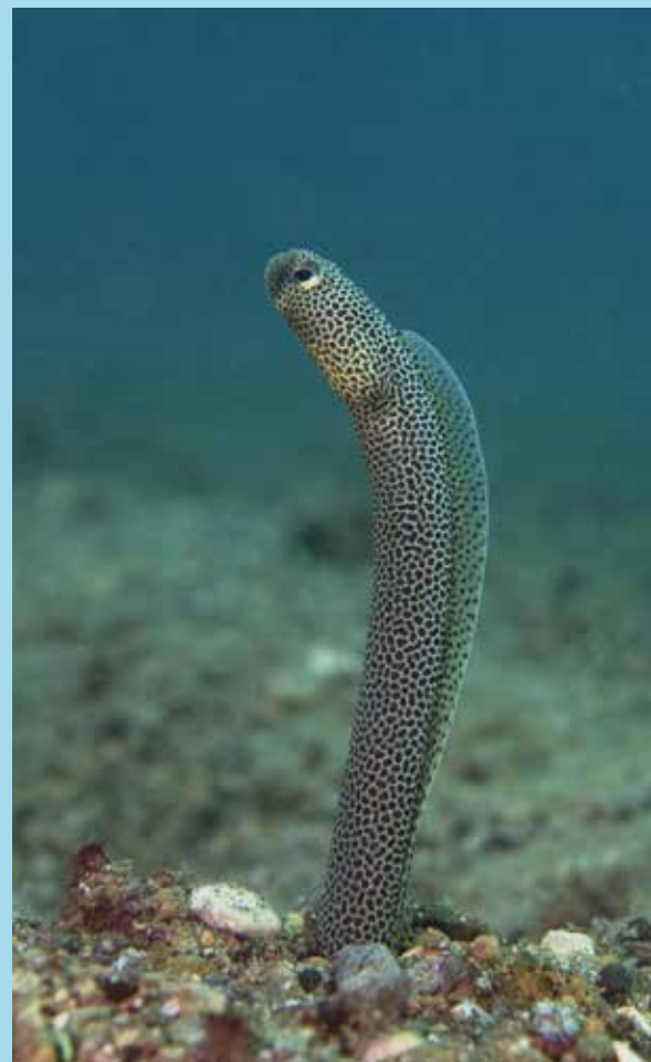
Zand aal, Negros