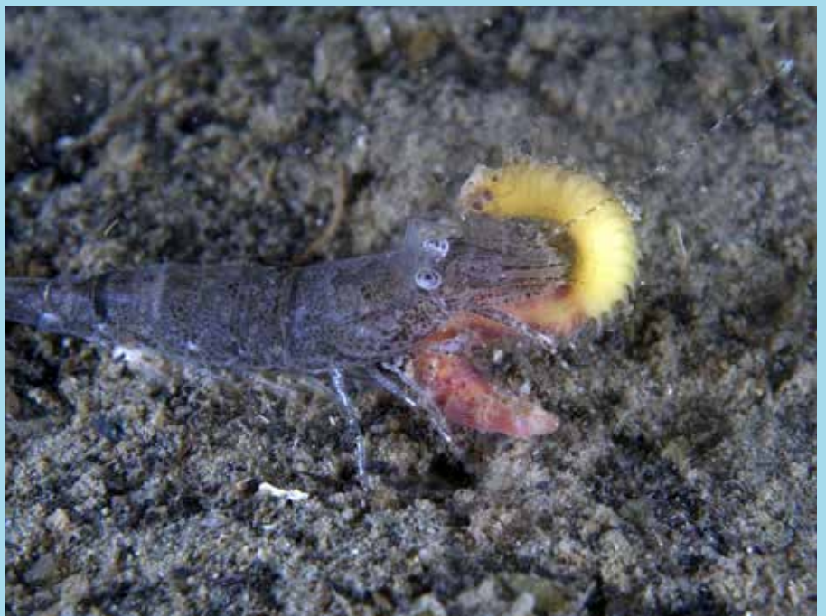
Garnaal met zager Grevelingen