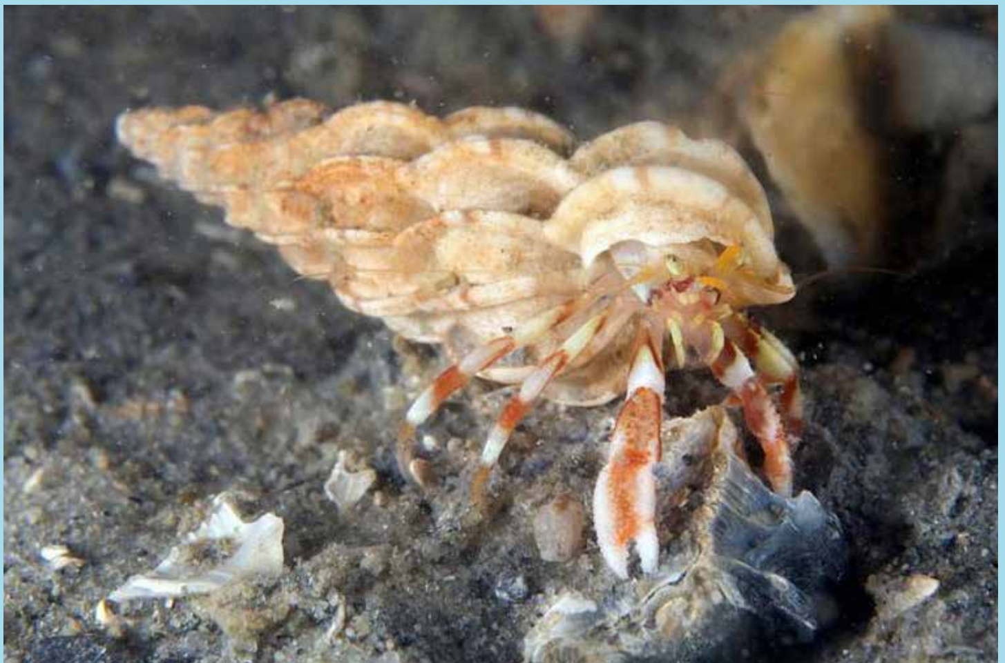
Wenteltrap met heremietkreeft, Oosterschelde