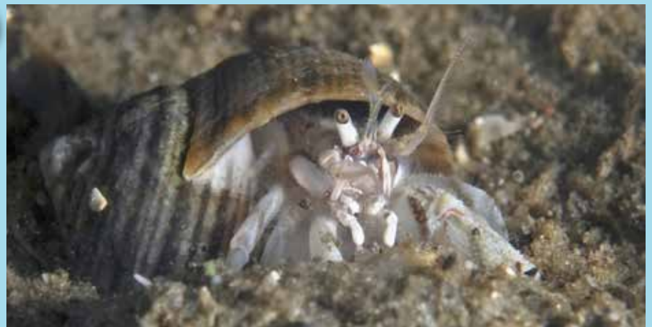
Diogenes pugilator , kleine heremietkreeft, Noordzeestrand