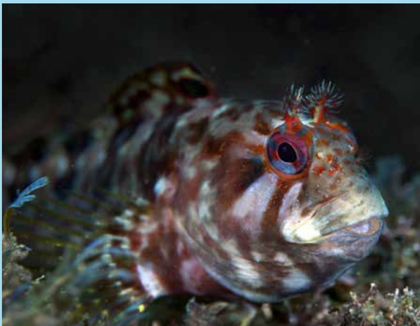
Gehoornde slijmvis Parablennius gattorugine