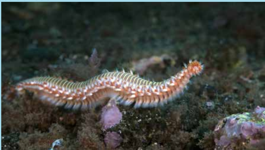
Borstelworm Hermodice carunculata