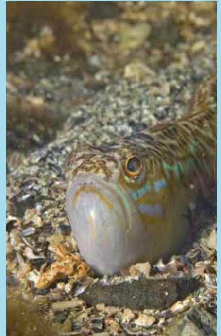
Grote Pieterman Noorwegen