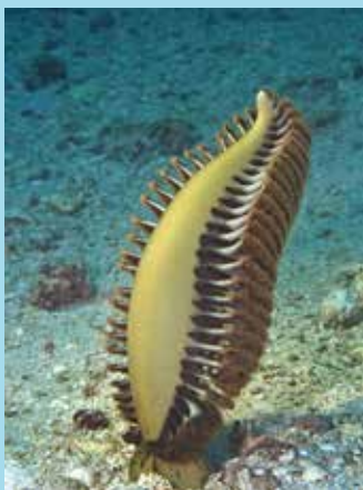
Zeeveer bij Komodo