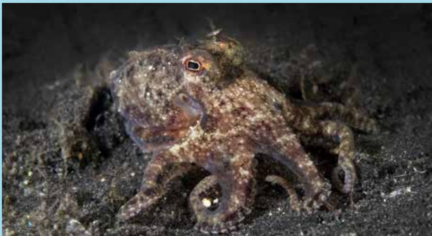
Octopus op Lembeh