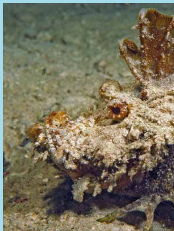
Indian Walkman sipadan