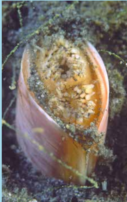
Ensis americanus , mesheft Oosterschelde

In de fjorden van Noorwegen liggen – zoals overal natuurlijk - de platvissen in het zand. Daar op zoek naar heilbot, die kan wel 4 meter lang worden. Veel platvissen gezien, maar geen heilbot. Wel schollen in overvloed. Natuurlijk zijn platvissen ook in Nederland te vinden. Maar toch maar een goede foto van een tong in de Oosterschelde, dat begint ook al een zeldzaamheid te worden. Al die heisa over de paling... . Vaker te zien dan tong. Maar dat is een ander onderwerp. Ook in Noorwegen de zee-veer. Bekend van tropisch water, maar niet in het koude water. In Kristiansand zelfs twee verschillende soorten gevonden. Zodra met de lamp wordt geschenen krult de zee-veer zich om en kan hij helemaal in het zand verdwijnen. Er wonen ook vaak garnalen en krabjes in. In de tropen, tijdens nachtduken, zijn er krabben, maar ook slakken met huisjes, die uit het zand komen kruipen, zodra het donker wordt. Er zijn ook enorme slakken zonder huis, de pleurobranchi (meer kieuwigen), ze kunnen wel 30 cm worden. Hoe ze dan ademen onder het zand is een raadsel. Misschien hebben ze niet veel lucht nodig, wanneer ze overdag gewoon stil zitten.