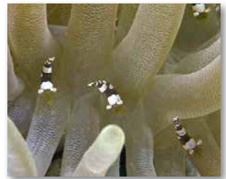
Port Marie Curaçao

Daar in de baai wel de flamingotong. Zelfs een heleboel op een gorgoon. De vraag is of een gorgoon zo'n invasie kan overleven. De flamingotong ( Cyphoma gibbosum ) is een slakje wat altijd leeft op het gorgoon, waarvan hij de bovenste laag eet. Er is dan ook precies te zien waar het slakje heeft gelopen. Ze hebben een prachtige huid, die over de