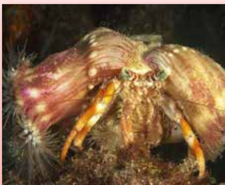
Pagurus acadianus , heremiet Wakatobi

een zuignap op zijn kop. De gestreepte zuigvis ( Echeneis naucrates ) is een graag geziene gast bij veel grote zeedieren zoals: schildpadden, manta's en zelfs bij haaien! Op de foto is de remora te zien vlak bij de bek van de tijgerhaai ( Galeocerdo cuvier ) maar toch wordt hij niet opgepeuzeld. De remora houdt de grote dieren schoon en vrij van parasieten. Daaruit is te concluderen, dat het poetsen belangrijker is dan eten!