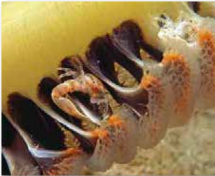
Thor amboinensis op Curaçao

Symbiose is het samenleven van verschillende diersoorten. Dit samenwonen zou voor beide dieren voordeel moeten geven. Zodra er maar voor één dier voordeel is te vinden heet het comensalisme en als een dier nadeel heeft, dan wordt het parasitisme genoemd. Voor veel duikers en fotografen is het een fascinerend onderwerp. Er zijn veel voorbeelden te noemen van symbiose naast dus het bekende samenwonen van anemoonvissen in de anemoon.