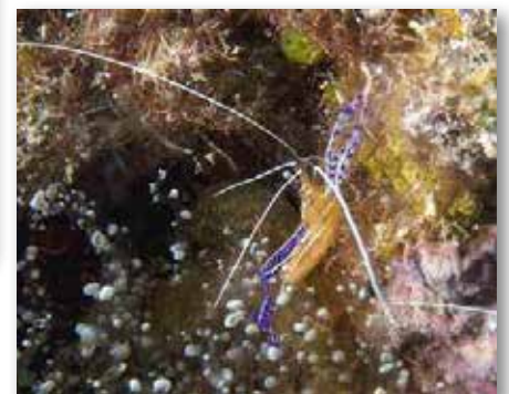
Periclimenes pedersoni garnaal, Curaçao

Nog een slak, die zijn gastheer opeet, is de longicirruslak. Op de foto op deze pagina's bovenop het lederkoraal, waarvan hij zit te knabbelen. De draadslak is alleen maar op dit lederkoraal te vinden, hij eet niets anders. Waarschijnlijk heeft het te maken met de zoöxantellen in het lederkoraal. Een heel bijzondere vondst van de gids op Lembeh. Hij is overigens best wel groot, zo'n 10 a 12 centimeter en een duidelijk voorbeeld van een parasiet.