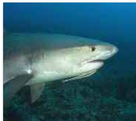
Tijgerhaai met remora

De spitssnuitkoraalklimmer zit altijd in de grote gorgoon. Misschien dat zijn bijzondere tekening van strepen en ruiten juist wegvalt in de wirwar van gorgoon-