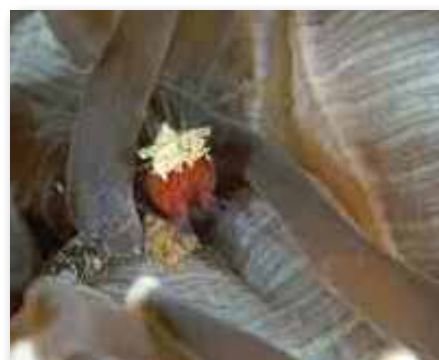
Periclimenes kororensis , Anilaokrab in koraal

vaak met z'n tweeën en ze doen de zee-egel geen kwaad. Ook schuilen er vaak visjes in de zee-egel. Zo voelen de kardinaalvisjes zich veilig tussen de puntige stekels. In het aquarium van de Burgers Zoo is verteld dat bangai kardinaalvisjes muilbroeders zijn. Bij gevaar nemen ze de kleine visjes op in hun bek, maar zodra de visjes groter worden, worden ze uitgespuugd tussen de stekels van de zee-egels. Op Lembeh en Bali is ook