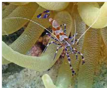
Periclimenes yucatanicus , symbiosegarnaal

Daar echter geen squatshrimp. Wel een prachtig krab, de Banded clinging crab ( Mithrax cinctimanus ). Hij is heel schuw en het duurde dan ook heel lang voordat een goede foto kon worden genomen. Normaal gesproken niet zo geduldig, maar nu met een opdracht, een 'mission', moest het wel. De volgende search was op het huisrif van Habitat en daar tijdens een nacht-