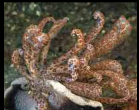
Phylloidesmium longicirrum slak op leder koraal, Lembeh

Een andere vorm van symbiose is waarbij een van de partners voordeel heeft, maar de andere nadeel ondervindt. Dit heet eigenlijk parasitisme, zoals de witte slak ( Luetzenia asthenosoma ) op de vuurzee-egel ( Asthenosoma varium ). Nu is natuurlijk de vraag wat zo'n slakje