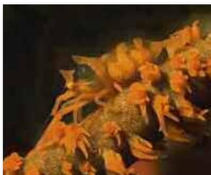
Dasycaris zanzibarica , garnaal op zweep koraal Lembeh

Nog een diertje op deze zee-egel is de zebra krab ( Zebrida adamsii ). Ze zijn