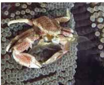
Neopetrolisthes maculatus , porcelijnkrab

Zo nu en dan is een hele kale plek rondom de garnaaltes te zien. Wie al eens door zee-egels is gestoken kent de pijn en heeft dus zeker geen medelijden met een zee-egel?