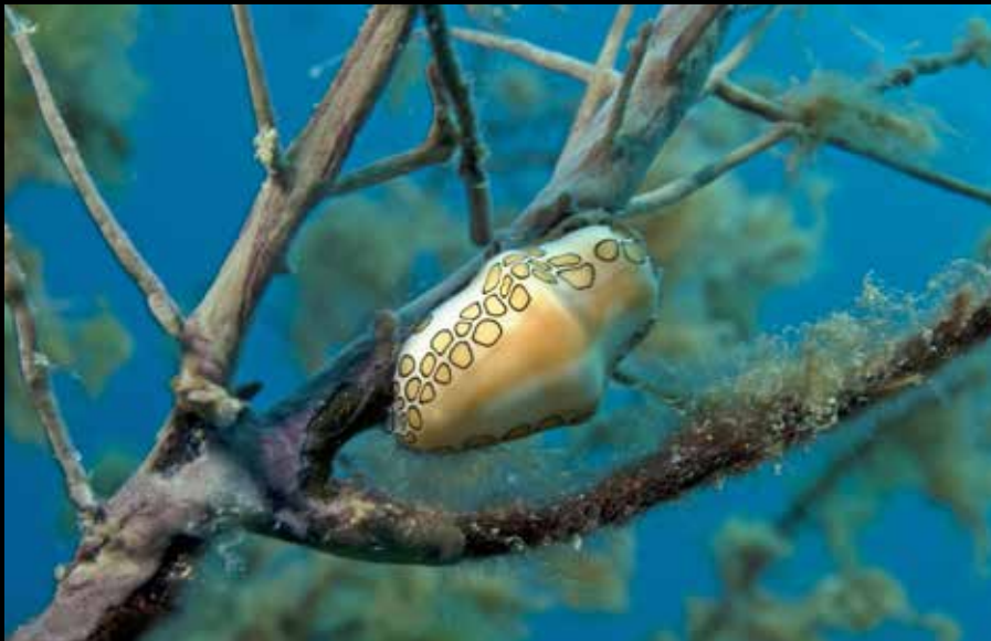
Cyphoma gibbosum , flamengotong Curaçao