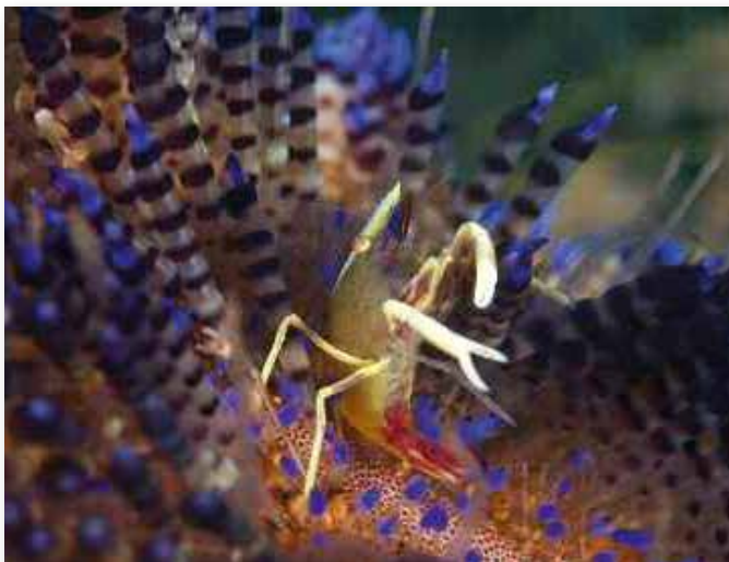
Allopontonia iaini , Commensal shrimp, garnaal op vuurzee-egel, Anilao