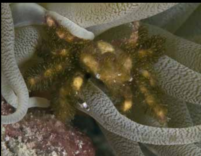
Mithrax cinctimanus , banded clingin crab Curaçao

De Coleman garnalen ( Periclimenes colemani ) zijn ook alleen maar op de vuurzee-egel te vinden. Ze eten de zachte tentakels van de zee-egel, die vindt dat zeker niet fijn!