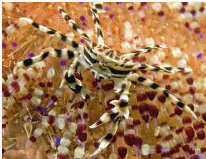
Zebrida adamsii zebrakrab, Sabang