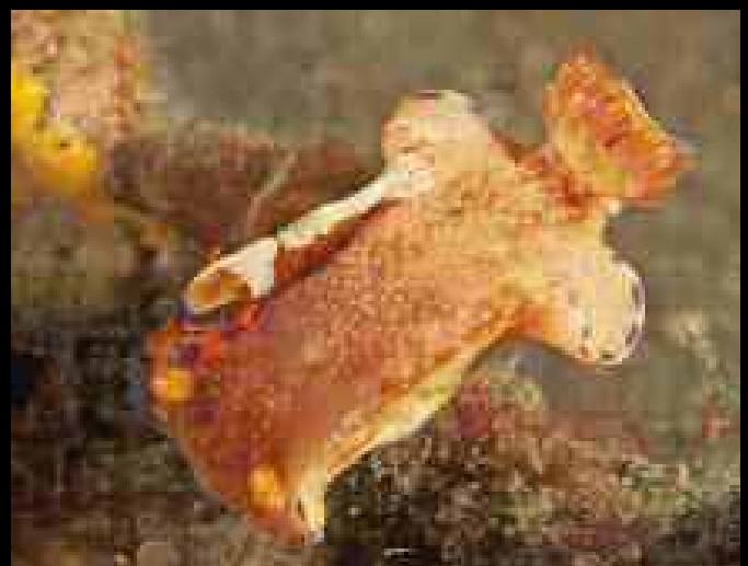
Periclimenes imperator , garnaal op Ceratosoma trilobatu slak, Lembeh