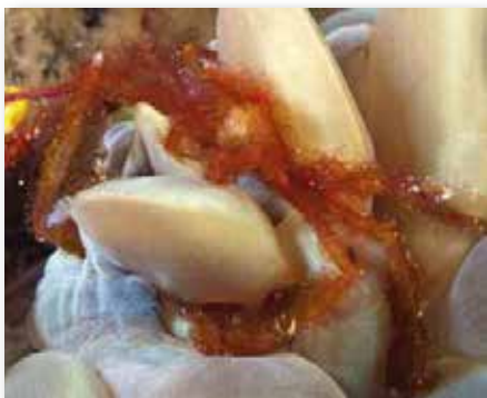
Achaeus Japonicus , orang oetang krab in koraal Wakatobi

vuurzee-egel is een klein garnaalte. Eerst werd gedacht dat het een krabje was. Er ontstond zelfs een discussie om het nieuwe diertje. Gelukkig had het duikresort in Anilao het boek van Debelius over Crustacea. Daar staat duidelijk op pagina 176 dat het een garnaal is, met de naam Allopontonia iaini . Einde discussie over krab of garnaal! Hoewel deze samenlevingsvorm een echte symbiose is, is niet precies bekend wat het voordeel is voor de zee-egel. Dat de garnaal bescherming geniet is wel duidelijk!